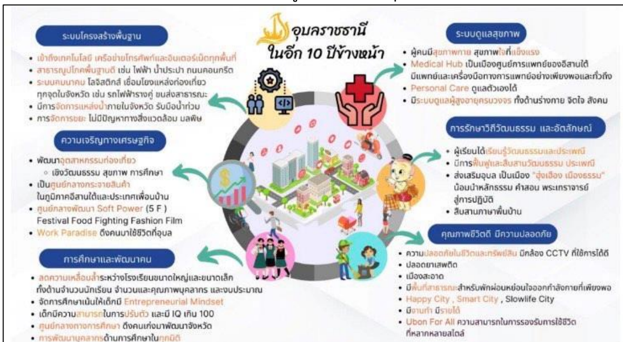
ภาพที่ ๒ แสดงภาพอนาคตของอุบลราชธานีในอีก ๑๐ ปีข้างหน้า