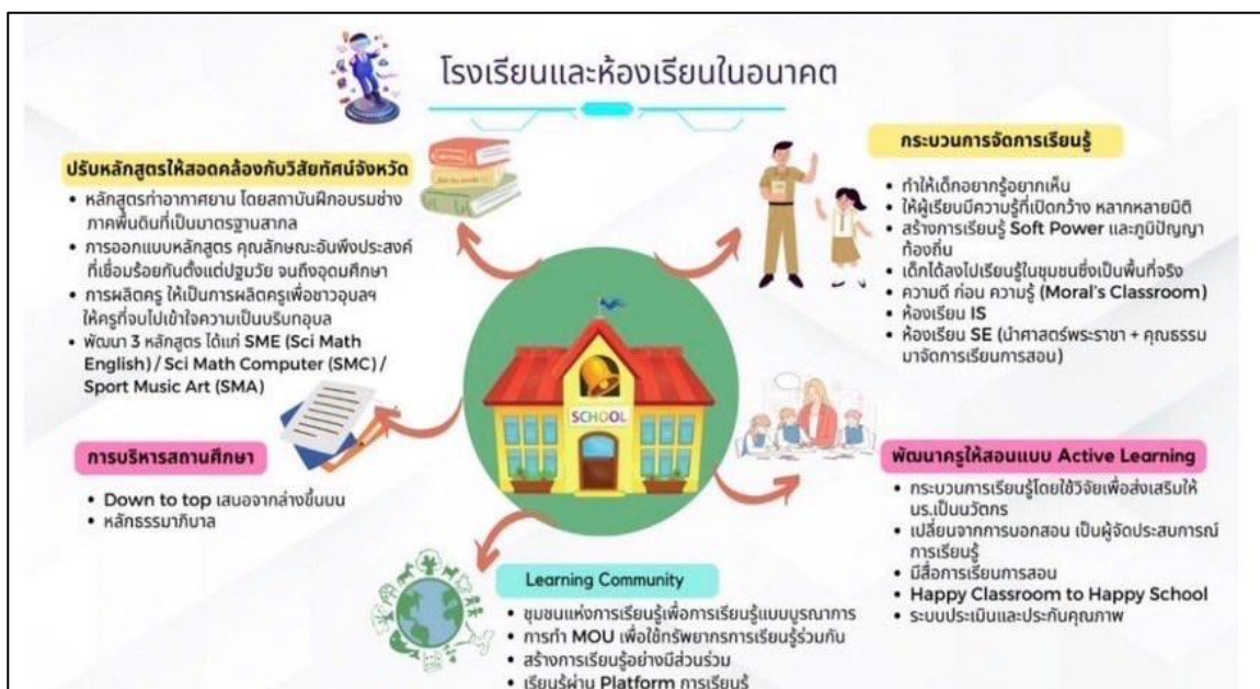
ภาพที่ ๔ แสดงโรงเรียนและห้องเรียนในอนาคต

จากการวิเคราะห์ข้อมูลที่ได้จากการทำกิจกรรมการประชุมเชิงปฏิบัติการแบบมีส่วนร่วมเพื่อออกแบบและขับเคลื่อนพื้นที่นวัตกรรมการศึกษาโดยใช้กระบวนการประเมินเชิงพัฒนา (Developmental Evaluation) กิจกรรมการระดมความคิดเห็น “พลังเด็กและเยาวชนจังหวัดอุบลราชธานี มาเป็นข้อมูลพื้นฐานในการกำหนดวิสัยทัศน์ เป้าหมาย ของหลักสูตรแกนกลางการศึกษาขั้นพื้นฐานพื้นที่นวัตกรรมการศึกษาจังหวัดอุบลราชธานี