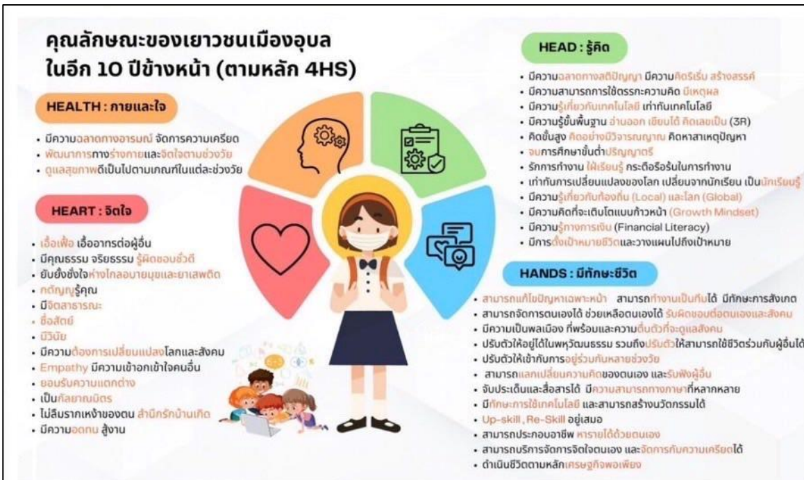
ภาพที่ ๓ แสดงคุณลักษณะของเยาวชนเมืองอุบลในอีก ๑๐ ปีข้างหน้า (ตามหลัก ๔HS)